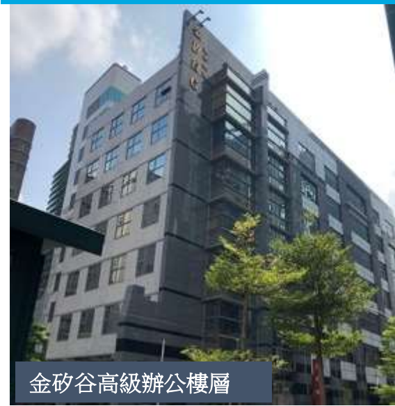
金矽谷高級辦公樓層